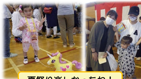
夏祭り楽しかったね!