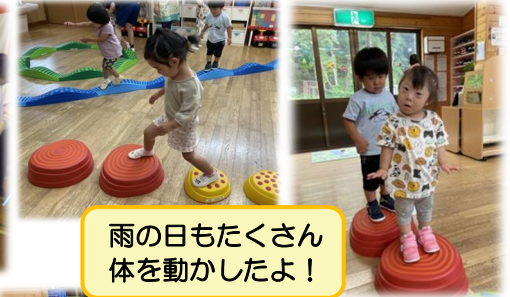
雨の日もたくさん体を動かしたよ!