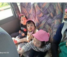
バスに乗ってしゃぼ〜つ!