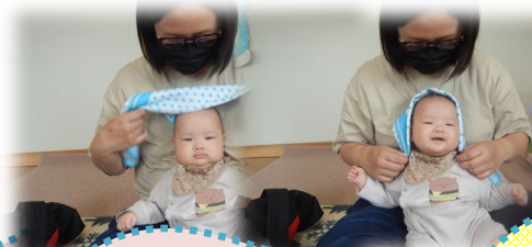
ハンカチ遊びで いないいないば～！