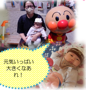
元気いっぱい 大きくなあれ！