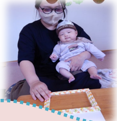
ママと一緒にフォトフレーム作り どんな作品ができるかな？