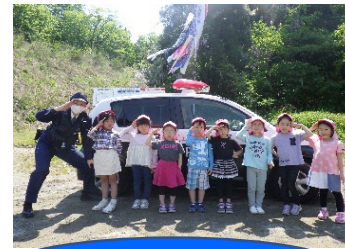
交通安全来園指導