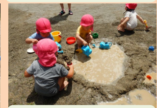
もっとおおきくなった！