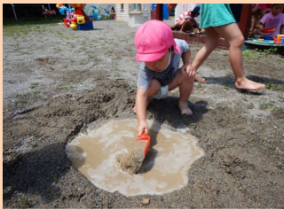
おおきな水たまりができたよ