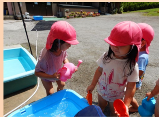
もっと水くんでくるね！