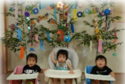
元気に過ごせますように