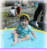
噴水マット楽しいね♪