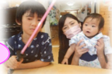
甚平姿がかっこいい♥