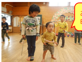
お兄ちゃんと一緒に白虎隊踊ったよ!