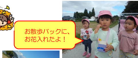
お散歩バックに、お花入れたよ!