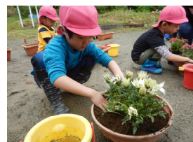
花の苗を植えたよ