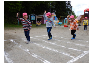
横断歩道を渡ろう