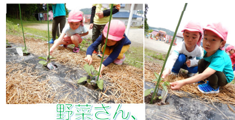
野菜さん、大きくなってね