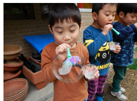
しゃぼん玉で絵を描いたよ