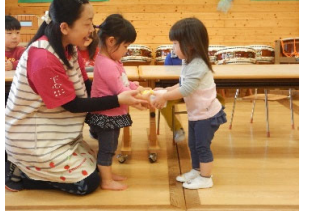
お誕生日おめでとう! ありがとう!!