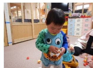
ポケットにおもちゃ いっぱい入れちゃった!