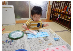
タンポ ペタペタ 楽しいなあ!