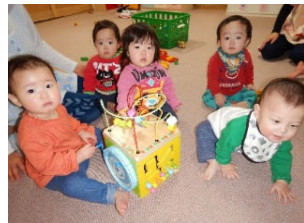
みんな揃って ハイポーズ!!