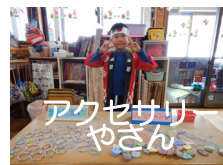
アクセサリやさん