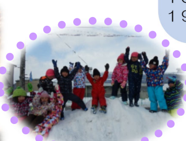
ゆきあそび だいすき