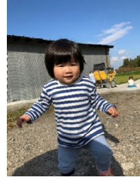
みんな靴を履いて上手に歩けるよ