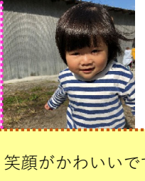
笑顔がかわいいですね