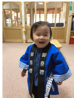
餅つきのハッピーだよ