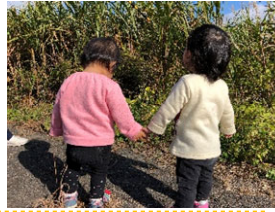
手をつないでどんな