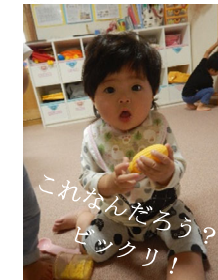
これなんだろう? セックリ!