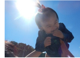
高い高いでキャーと大喜びでした!