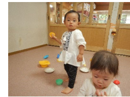
新しいお友だちも楽しく遊べるようになりました! みんな仲良くしてね!