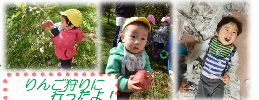
りんご狩りに行ったよ!