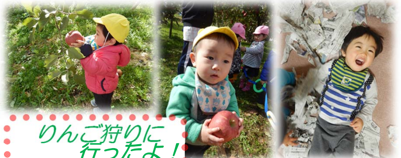
りんご狩りに行ったよ!