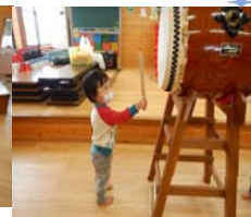
十日市ごっこ & 和太鼓来園指導