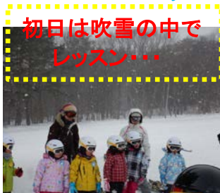
初日は吹雪の中で レッスン...