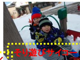
そり遊びサイコー！